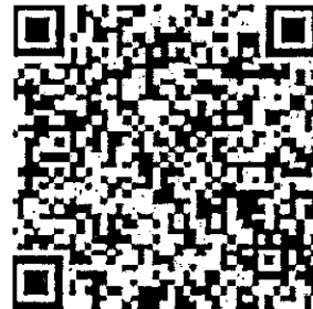
แบบฟอร์มหนังสือรับรองจากหน่วยงานต้นสังกัด

ทั้งนี้ คณะกรรมการจะพิจารณาเฉพาะข้อมูลที่ได้กรอกผ่านระบบดังกล่าวภายในระยะเวลาที่กำหนดเท่านั้น